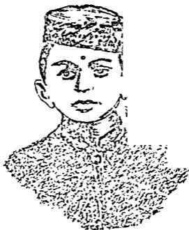
बालक महात्मा गांधी

राष्ट्रपिता गांधी जी भी थे, बालक जंगे कभी तुम्हारे । बिन्दु आदमी—गच्छाई में, मगने थे तुम मगने ग्यारे ।